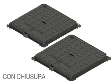
CON CHIUSURA A SCATTO