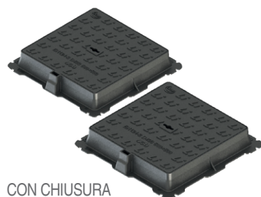
CON CHIUSURA A SCATTO